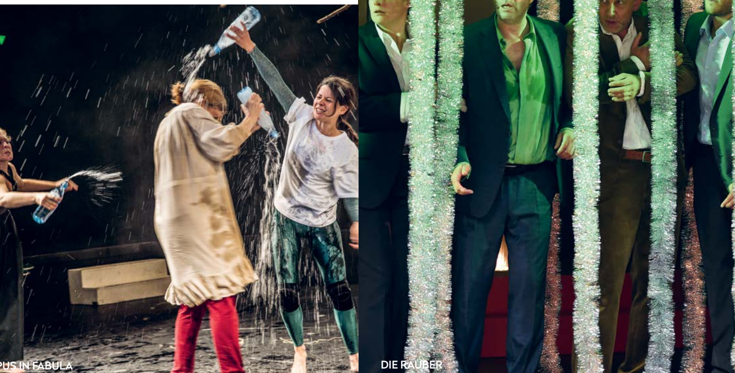
LUPUS IN FABULA