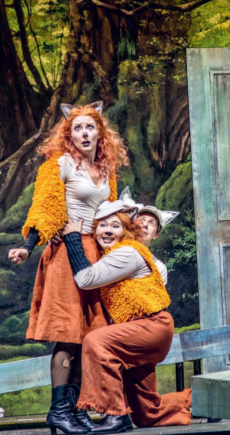
DAS SCHLAUE FÜCHSLEIN