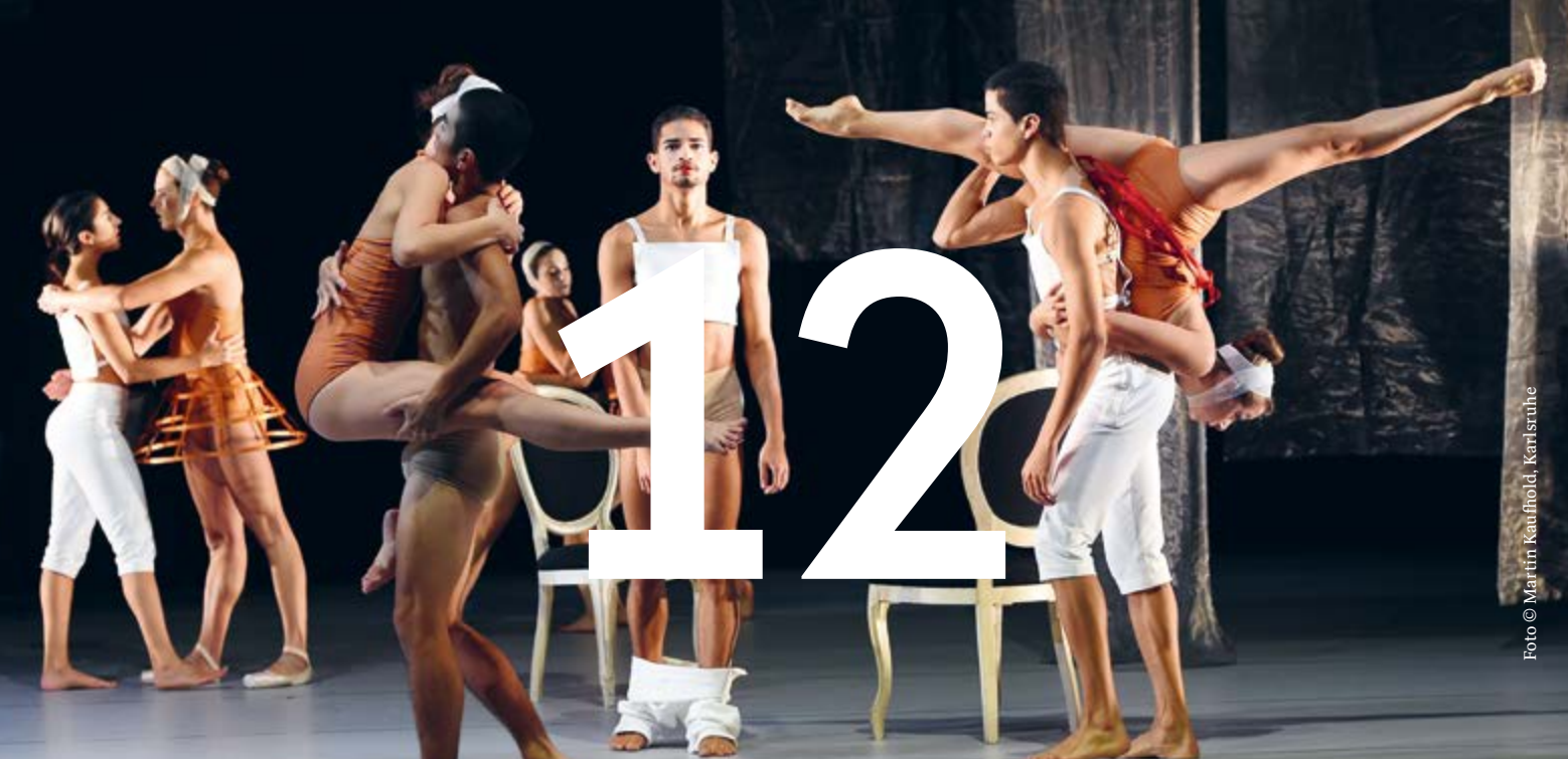
FACES OF LOVE Tanztheater in zwei Teilen von Beatrice Panero und Noel Pong 04/12 + 06/12 + 14/12/2019