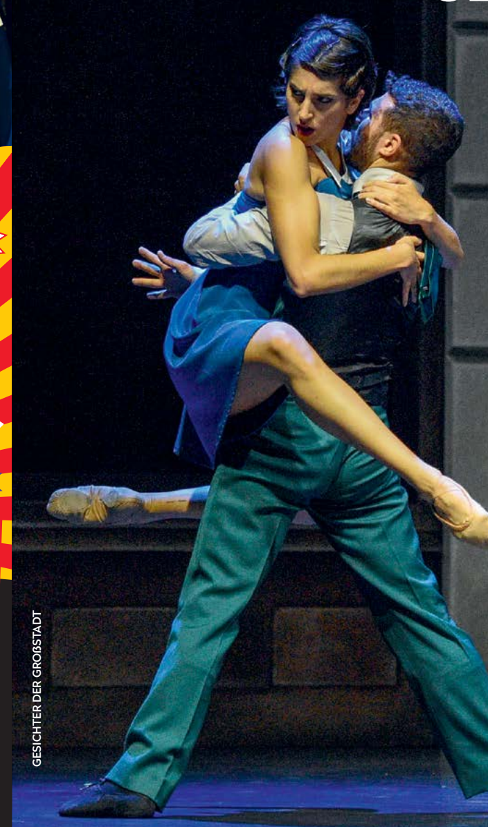
GESICHTER DER GROSSSTADT